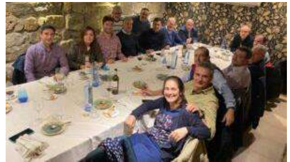
Comida en Palencia.