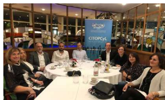
Cena en Zamora.