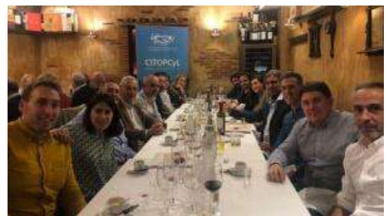
Comida en Salamanca.