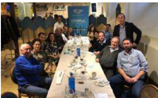
Comida en León