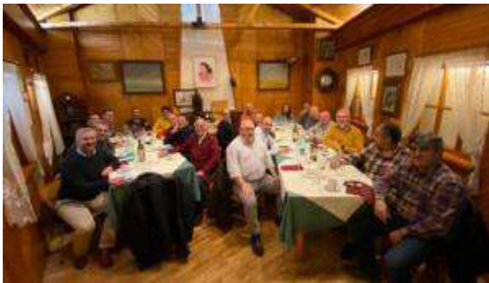
Comida en Valladolid.